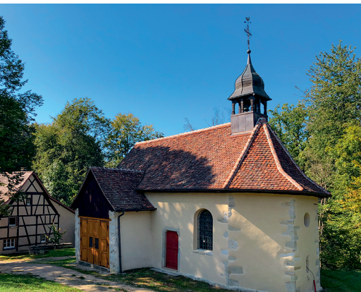
La chapelle Saint-Brice, dans une clairière près de la frontière franco-suisse.

Auberge de la chapelle Saint-Brice (F), +33 389 07 35 86