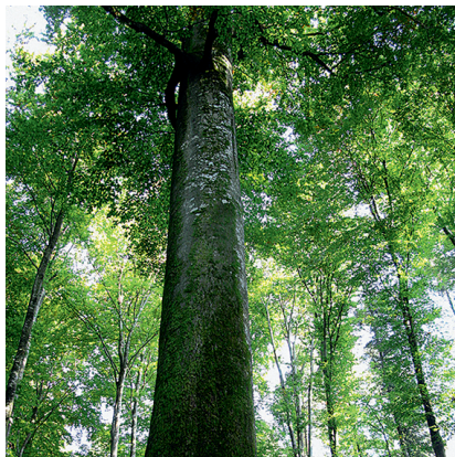
Un hêtre géant près de Saint-Brice. Photo: 5. Randonnée en forêt dans le canton de Soleure.