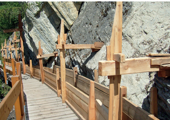
Der ausgebaute Wanderweg entlang der Suone Torrent-Neuf.

Buvette des Vouasseurs, 079 436 74 01, www.torrent-neuf.ch