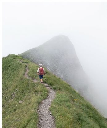
Randonnée aérienne par le Brisen vers la station supérieure de Haldigrat.