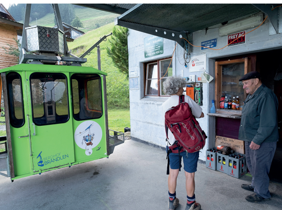
La randonnée débute par le trajet vers le Brändlen. Une cabine est verte, l'autre est bleue.

www.kleinseilbahnen.ch . Pour les trajets, se munir de suffisamment de monnaie ou de petits billets.