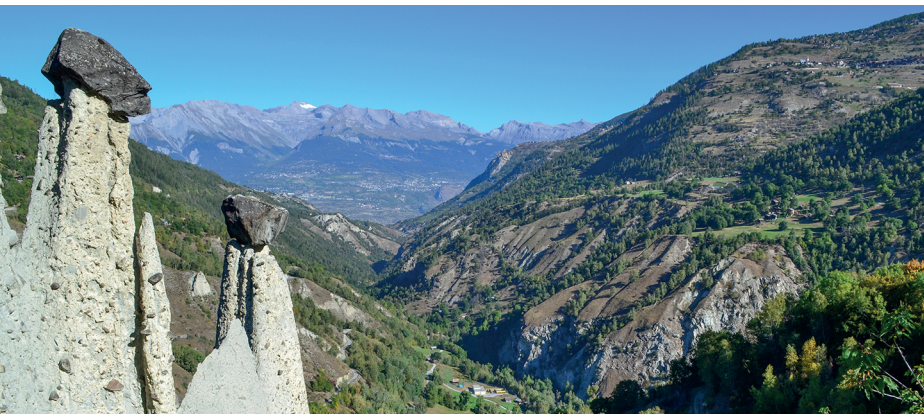
Des blocs de pierre pesant des tonnes protègent la roche de l'érosion.

Café-restaurant de la Poste, La Vernaz, 027 207 12 61