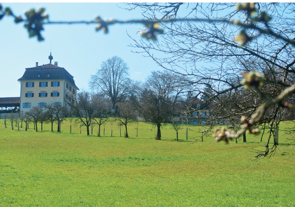
Le château fortifié de Wolfsberg surplombe le lac inférieur. Une agréable allée de pruniers y mène.

Le Chemin des fables de Thurgovie, www.thurgauer-wanderwege.ch Musée Napoleon Thurgovie, www.napoleonmuseum.tg.ch , 058 345 74 10