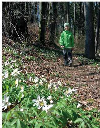
Les premiers messagers du printemps recouvrent le sous-bois.