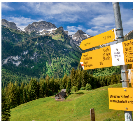
A gauche: la petite cité et le château de Werdenberg. A droite: vue depuis le Gasthaus Voralp sur les parois de la chaîne de l'Alvier.