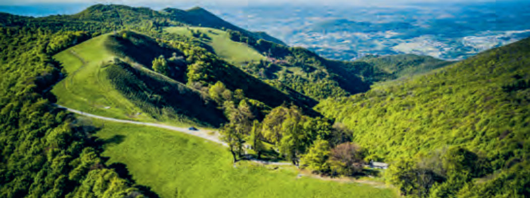
Vue sur la clairière Cascina d'Armirone dans la Valle dell'Alpe.