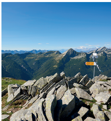
Natura selvaggia e pace totale: dalla cima del Pilone si apre la vista sulle valli ticinesi.