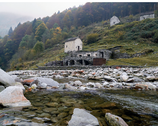
Il torrente Isorno entra in Svizzera dopo aver attraversato la frazione di Bagni di Craveggia.

Bar Onsernonese a Spruga, 091 797 17 83 Palazzo Gamboni a Comologno, 091 780 60 09, www.palazzogamboni.ch Osteria Al Palzign a Comologno, 091 797 20 68 Capanna Alpe Salèi, 091 797 20 32, www.alpesalei.ch