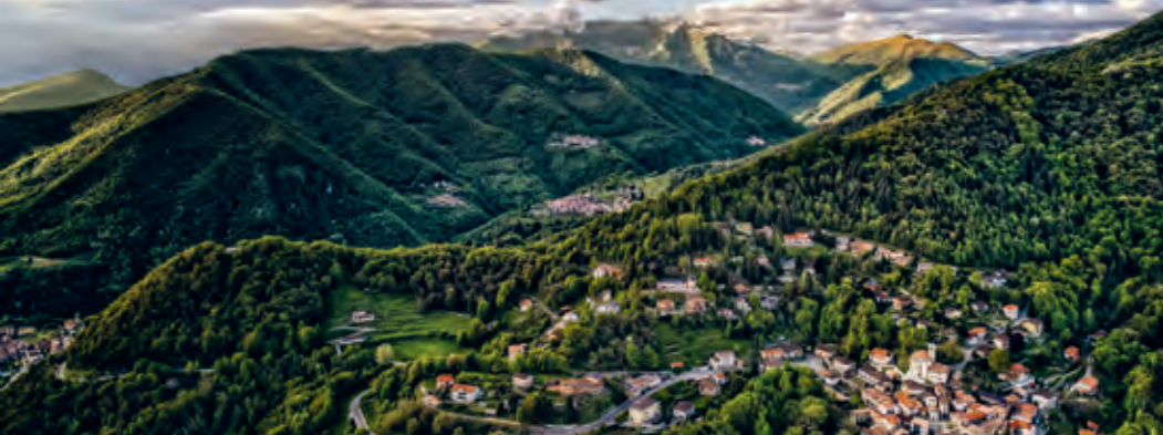
Veduta della Valle di Muggio. Il villaggio di Sagno si trova in basso a destra.