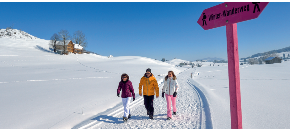
Auch im Winter ein reizvolles Wandergebiet: die Moorlandschaft Gontenmoos im Appenzellerland.

Luftseilbahn Jakobsbad - Kronberg, 071 794 12 89, www.kronberg.ch Appenzellerland Tourismus AI, 071 788 96 41, www.appenzell.ch