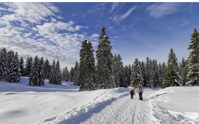
Mächtige Tannen und verschneite Weiden bei La Genolière.

Buvette La Genolière, St-Cergue, 079 418 82 46 Chalet d&#8217;alpage Le Vermeilley, 079 205 15 90, www.levermeilley.com