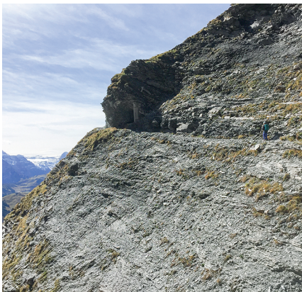
Im Schatten des Felsens steht das Gsür-Bänkli.