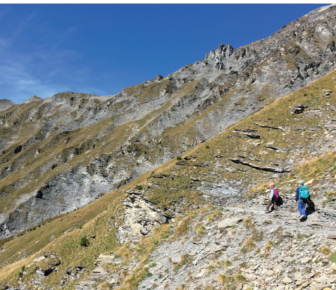
Mitten im Gsür-Krater drin ist Konzentration gefragt.

Restaurant Schermtanne, 033 673 10 51, www.schermtanne-adelboden.ch