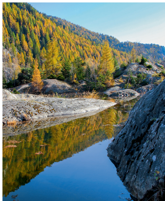
Links: uriger Alpstafel Oberaletsch. Rechts: ein Juwel im unteren Aletschwald, der Grünsee. Bilder Markus Ruff