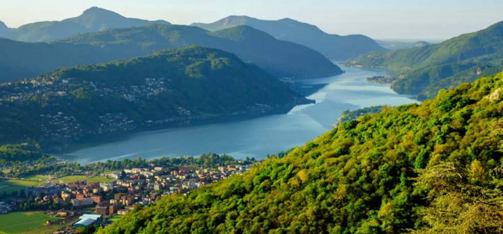
Traumblick von Cademario zum Lago di Lugano.