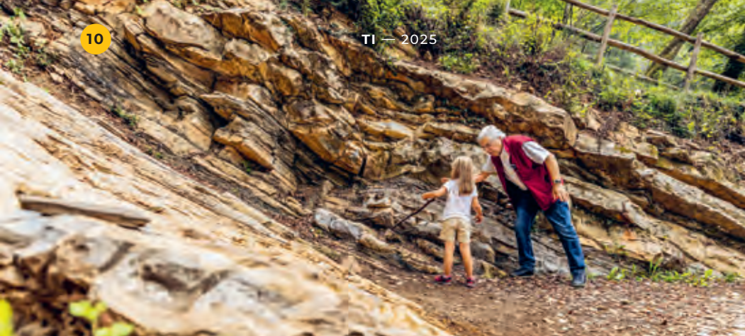
Allo scavo di Acqua del Ghiffo.